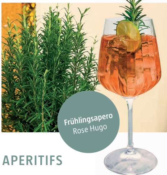
Frühlingsaperero Rose Hugo